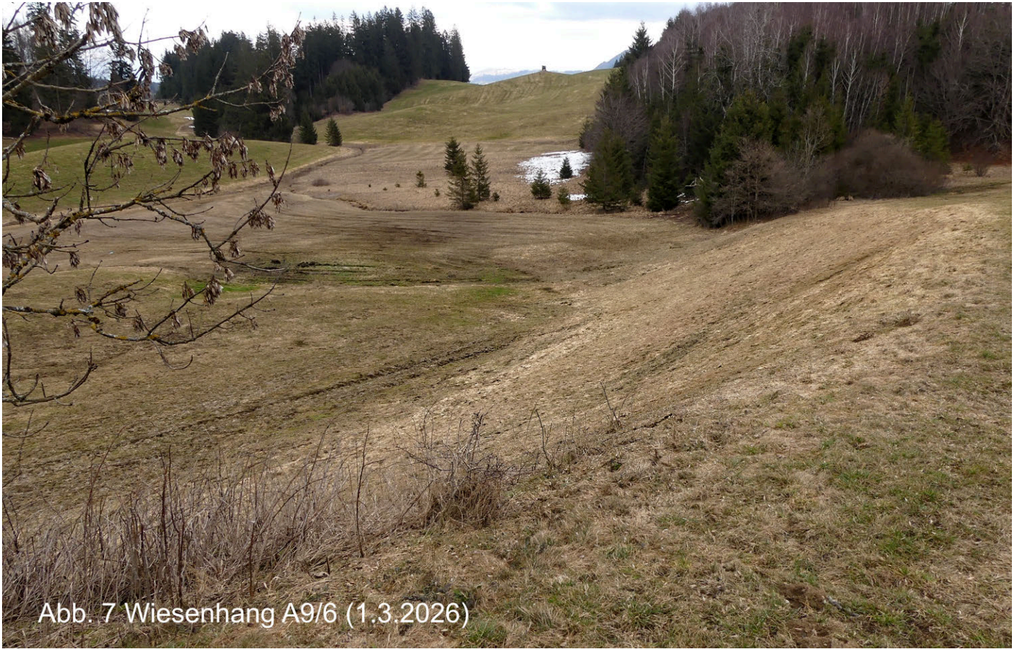
Abb. 7 Wiesenhang A9/6 (1.3.2026)