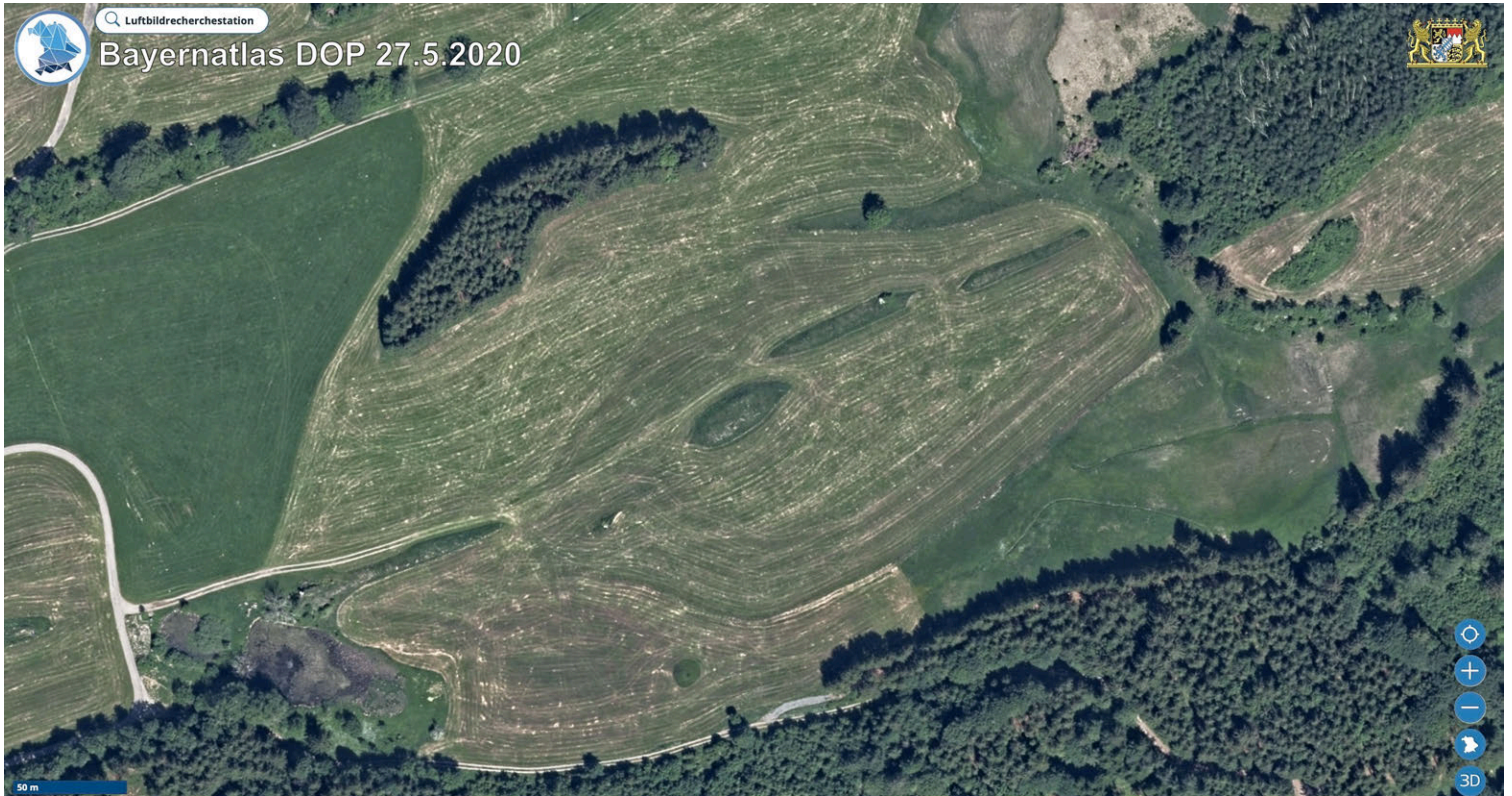
Abb. 2a Das digitale Orthophoto (DOP) vom 27.5.2020 zeigt die von der Intensivlandwirtschaft ausgesparten Nagelfluhrippen und die Steilhangwiese, die als Ausgleichsflächen in Abb.1 eingezeichnet sind.