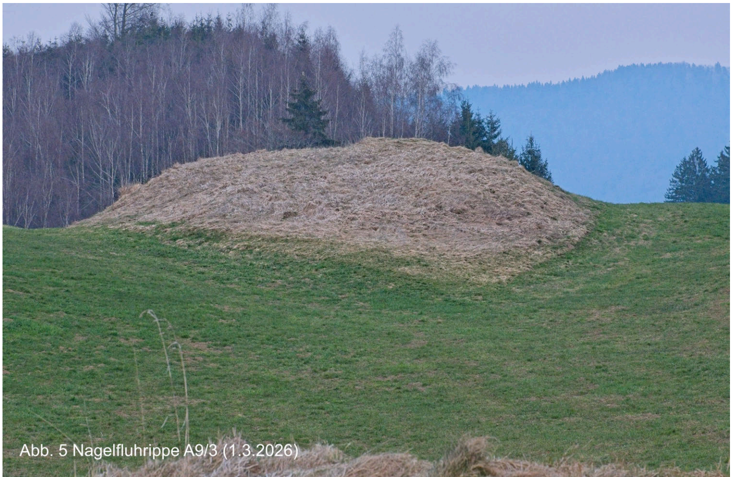
Abb. 5 Nagelfluhrippe A9/3 (1.3.2026)