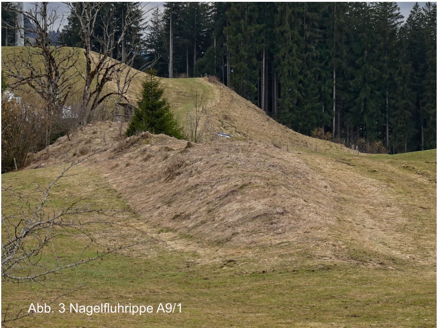
Abb. 3 Nagelfluhrippe A9/1