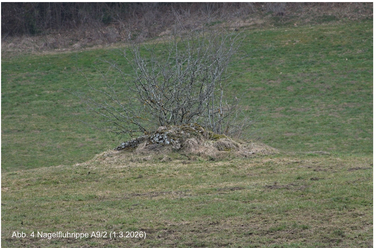
Abb. 4 Nagelfluhrippe A9/2 (1.3.2026)