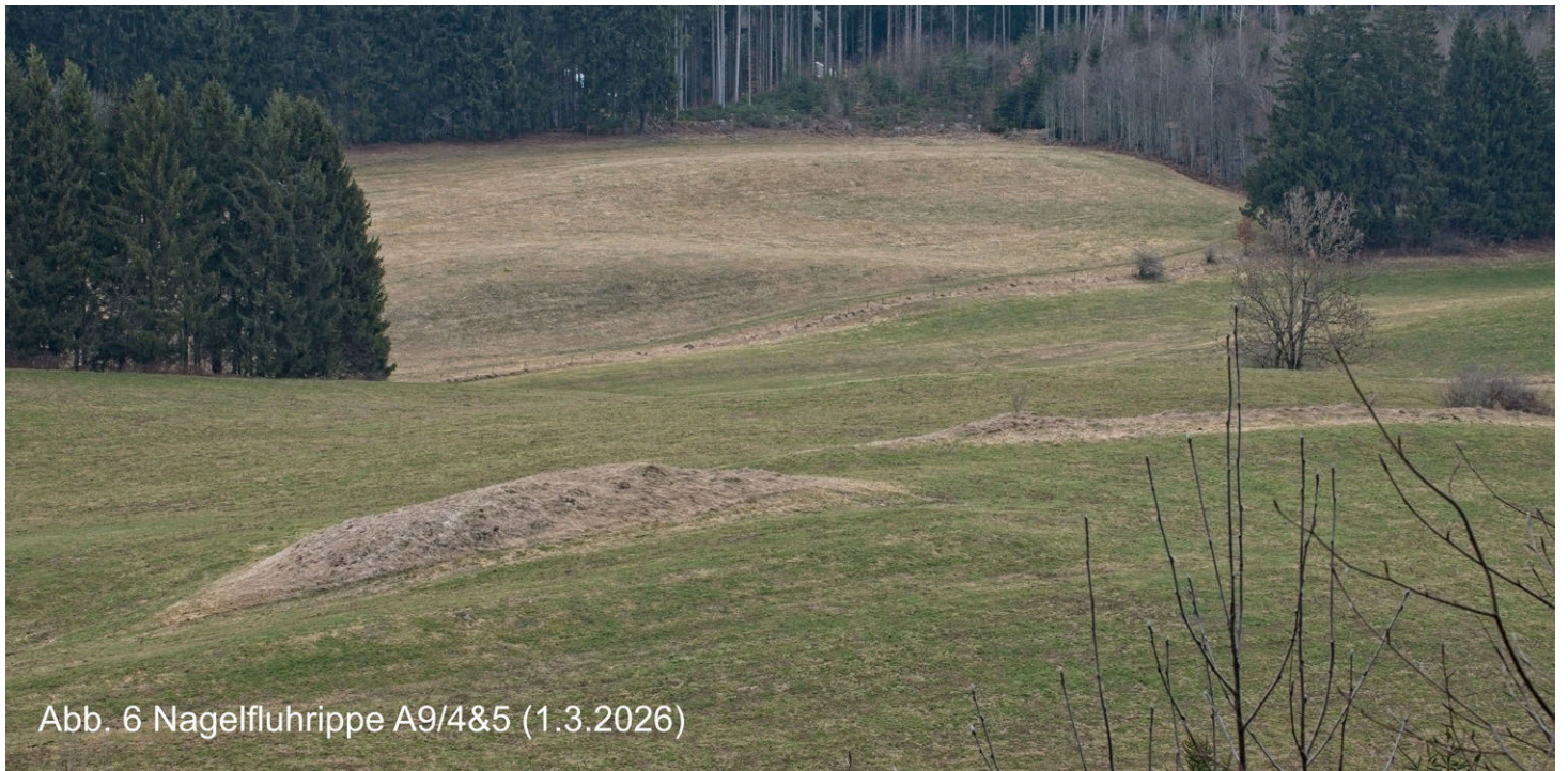
Abb. 6 Nagelfluhrippe A9/4&5 (1.3.2026)